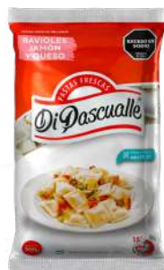
Ravióles recheados com presunto e queijo 500g.-1kg