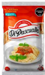
Macarrão clássico 500 g.