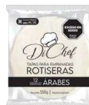
Massa fresca para pastel árabe 550 g.