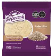
Dough discs for pies 400g