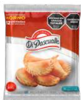
Massa fresca de pastel para o forno 300 g.