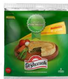
Massa para pastelão com redução de gorduras 400 g.