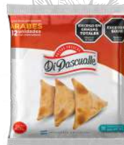
Massa fresca para pastel árabe 420 g.