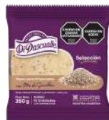
Empanada dough discs 350g