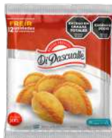
Massa fresca de pastel para fritar 300 g.