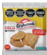
Massa fresca para pastel de vigília 350 g.