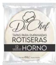
Massa fresca de pastel para o forno 450 g.