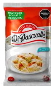
Ravióles recheados com carne e vegetais 500g.-1kg