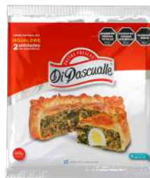
Massa folhada para pastelão 400 g.