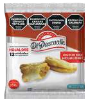
Massa fresca de pastel folhado 350 g.