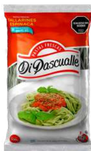
Macarrão de espinafre 500 g.