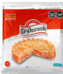
Massa para pastelão de forno 400 g.