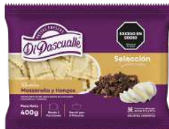
Raviólis recheados de muçarela e cogumelos 400g