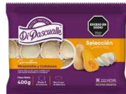
Mozzarella and pumpkin-stuffed sorrentini 400g