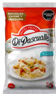
Ravióles recheados com frango e vegetais 500g.-1kg