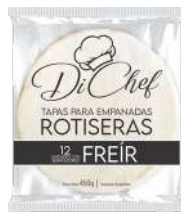
Massa fresca de pastel para fritar 450 g.