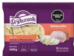
Raviólis recheados de muçarela e presunto 400g