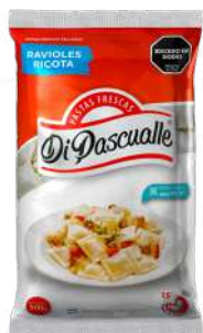
Ravióles recheados com ricota 500g.