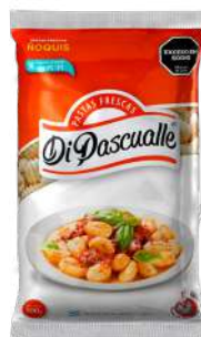
Nhoque 500 g.